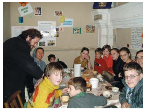
Estos son parte de los jóvenes que asisten a la catequesis en Pushkin

Desde aquí me gustaría pedir a todos que nos sigan apoyando con la fuerza de la oración, que siempre se siente y agradece.