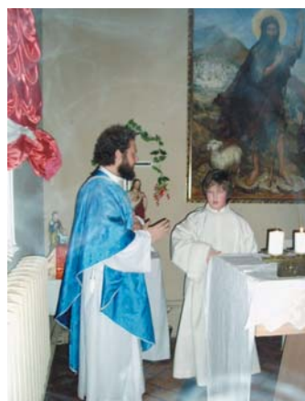
Uno de nuestros primeros monaguillos en Pushkin