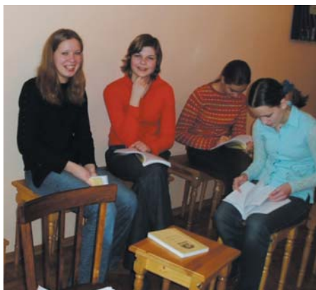
Jóvenes de Pushkin estudiando el Catecismo de la Iglesia Católica.