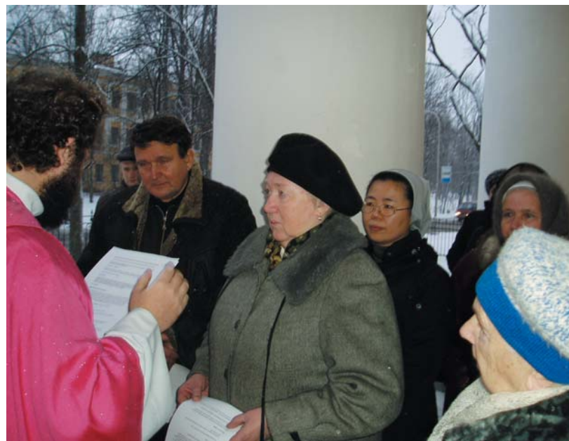
En esta imagen se recoge el inicio de la ceremonia de "aceptación como catecúmenos" de un adulto

Es difícil. Es más, todavía no lo hablo bien. Pero estos siete primeros meses han sido de bastante tiempo dedicado al estudio del ruso y se va notando. Ya celebro Misa en ruso, mantengo conversaciones con bastante normalidad, y voy entendiendo cuando me hablan.