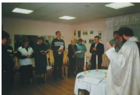
Misa en Ujtá, Komi, en una sala del Centro Eslavo. ¿Cuándo podremos tener allí una capilla?

Pero lo mejor fue el regalo que encontramos el día 9 de enero: un icono de la Virgen de Kazán . Al volver hacia casa entré en unos cuantos anticuarios y en uno de ellos, en la Nevski , me di cuenta de que estaba allí el icono esperándonos. Dicen que un icono no se