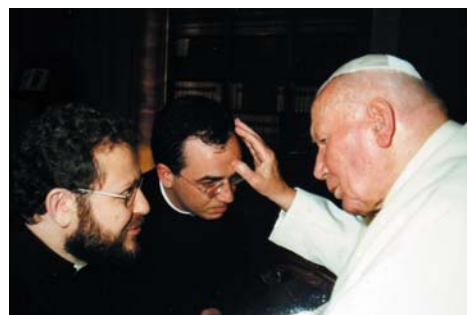
Antes de partir para Rusia, el Papa nos recibió unos momentos, y nos impartió su Bendición apostólica. Era el 28 de noviembre de 2002.

Terminamos esta presentación con una frase sacada de una de vuestras cartas: "Así que, por favor, seguid encomendando... Ha sido estupendo durante este año sentir que nos sosteníais con vuestras oraciones, cartas, incluso visitas..."