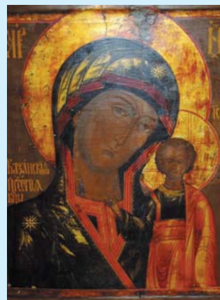
Nuestra Señora de Kazán