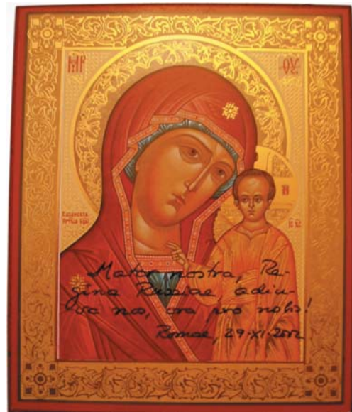
Icono de la Virgen al que miramos con especial cariño. Es un regalo que recibimos en Roma