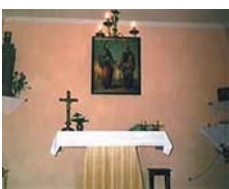
Capilla en Kolpino. Está situada en una habitación de un pequeño apartamento, en un tercer piso de un bloque de viviendas.

Luego, ¿cómo íbamos a quitar al Señor y a dejar la casa otra vez desangelada y fría? No fuimos capaces. Así que pasamos el año con el Señor reservado... y ya no se ha ido de casa. Esa noche también celebramos Died Marós , la fiesta del abuelo hielo y su nieta Sniegurushka , nievecilla, que es cuando los rusos se hacen los regalos (como su fiesta de Reyes ).