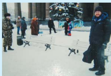
Nuestra primera Navidad rusa. Ha sido el invierno más crudo en muchísimos años.